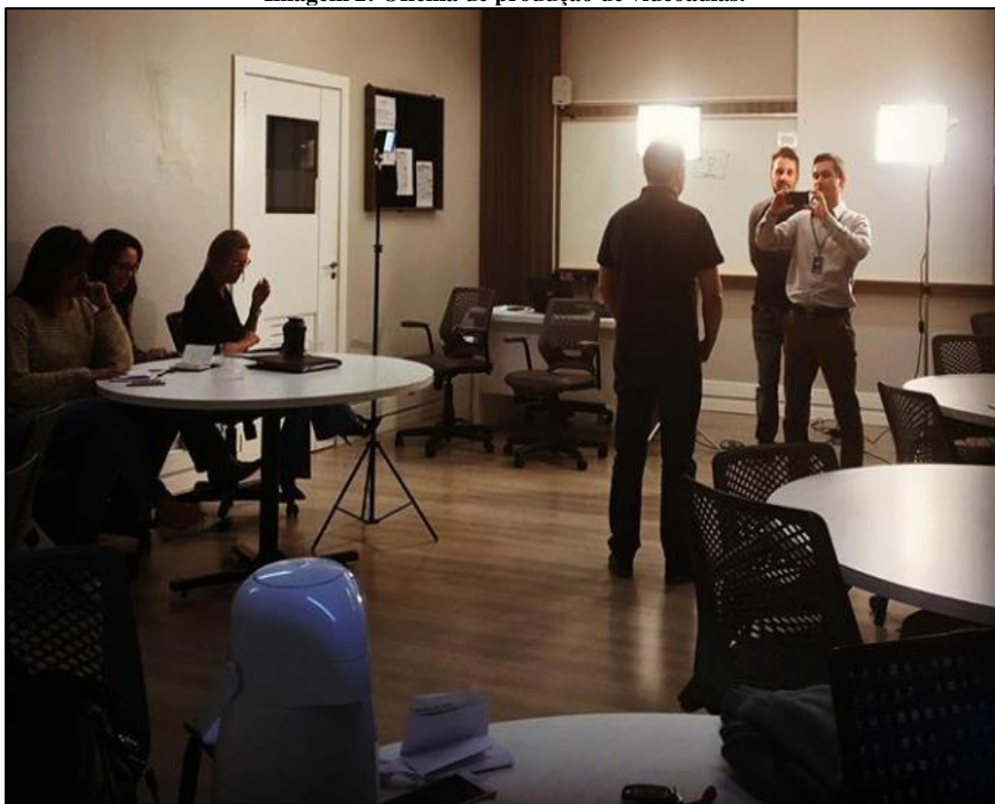
Imagem 2: Oficina de produção de videoaulas.

Além das formações docentes, também houve atividades desenvolvidas com colaboradores técnico administrativos. A formação teve um primeiro momento realizado de forma presencial, e teve sequência de forma on-line . O objetivo foi capacitar os funcionários técnicos-administrativos para que conheçam a estrutura e organização do ambiente virtual,