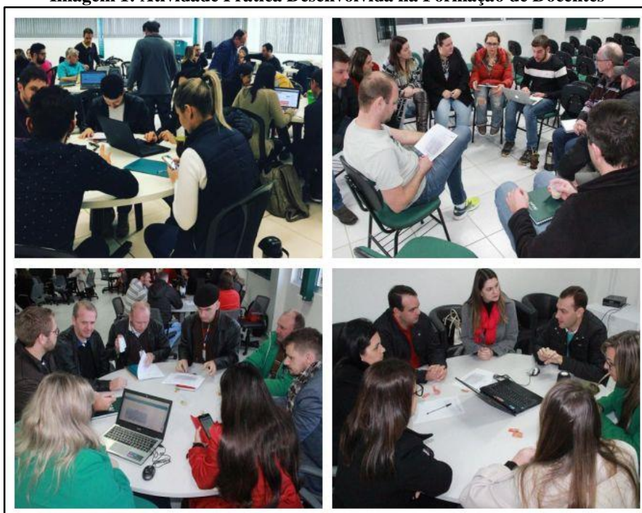
Imagem 1: Atividade Prática Desenvolvida na Formação de Docentes

Em maio e junho foi realizada a formação “Conhecendo o Mundo Virtual da Aprendizagem: Possibilidades e Desafios em Tempos de Conectividade”. Nela foram apresentados diferentes recursos virtuais disponíveis no Ambiente Virtual de Aprendizagem e diferentes metodologias pedagógicas, realizando a reflexão de como elas podem ser aplicadas de forma conjunta na prática docente. Após a apresentação dessas metodologias e recursos, os professores foram desafiados a planejar uma atividade pedagógica envolvendo determinado recurso e metodologia.