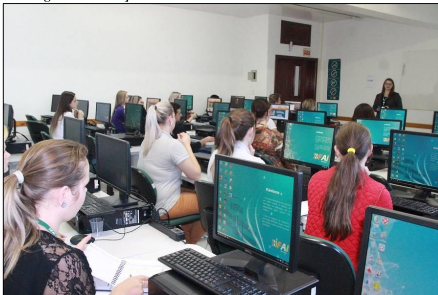
Imagem 3: Formação Nead com colaboradores técnico administrativos.

No mês de outubro, foi realizada a formação “Interagindo com as Ferramentas de Moodle”. Essa formação foi realizada com o objetivo de apresentar e demonstrar de maneira prática os recursos disponíveis na plataforma Moodle para todos os professores da instituição, de forma a estimular a utilização do ambiente virtual de aprendizagem também no desenvolvimento de atividades das disciplinas presenciais. Possibilitou aos professores interagirem com o ambiente e pensar em possíveis situações em que se poderia aplicar e usar os recursos como apoio em suas aulas.