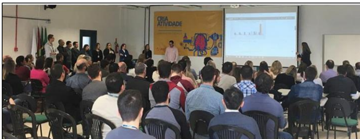
Imagem 4: Formação Interagindo com as Ferramentas do Moodle.

No mês de outubro, foi realizada a formação “Interagindo com as Ferramentas de Moodle”. Essa formação foi realizada com o objetivo de apresentar e demonstrar de maneira prática os recursos disponíveis na plataforma Moodle para todos os professores da instituição, de forma a estimular a utilização do ambiente virtual de aprendizagem também no desenvolvimento de atividades das disciplinas presenciais. Possibilitou aos professores interagirem com o ambiente e pensar em possíveis situações em que se poderia aplicar e usar os recursos como apoio em suas aulas.