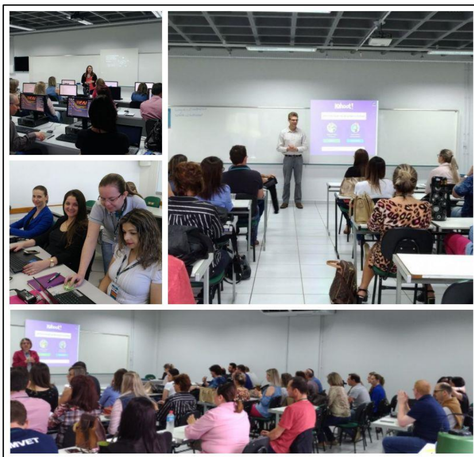
Imagem 5: Oficinas práticas realizada com professores.

Também em novembro, foi promovido um momento para socializar experiências dos próprios docentes sobre o uso de recursos virtuais e ambiente virtual de aprendizagem. Esta atividade formativa foi denominada “Tertúlia Interativa: compartilhando experiências e vivências do uso do Ambiente Virtual”. O objetivo desta atividade foi proporcionar um