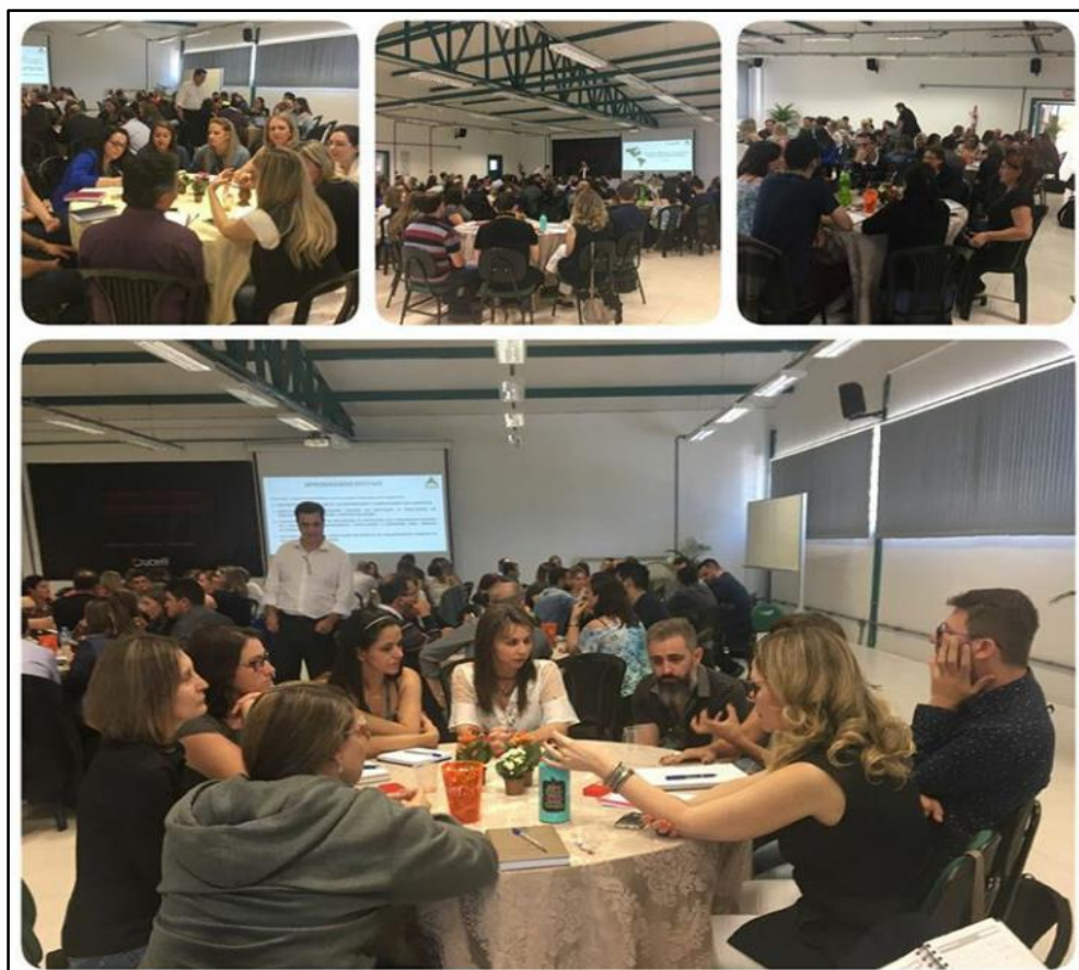
Imagem 7: Formação sobre Ensino Híbrido.

A partir de todas as formações e novas metodologias conhecidas, a UCEFF construiu de forma colaborativa um novo acadêmico, denominado Modelo LOOP, que permite maior autonomia do estudante ao traçar sua trajetória acadêmica. A fim de que os professores e colaboradores se integrassem a este novo modelo acadêmico, foram realizados diferentes momentos de socialização e sensibilização acerca do novo modelo acadêmico.